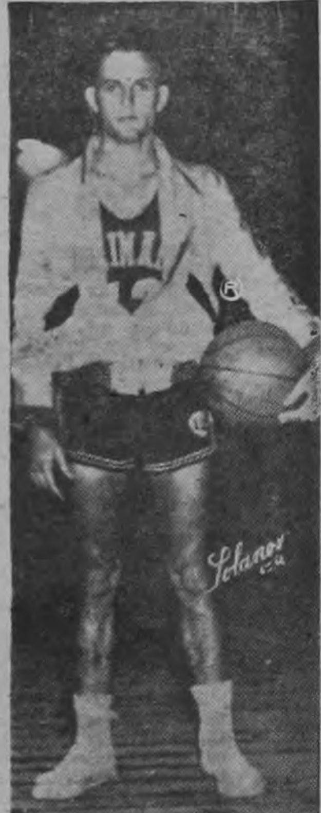
MONTEALEGRE — también gustó —

Es justo también informar que nuestro compatriota Eddy Bermúdez sí destacó mucho