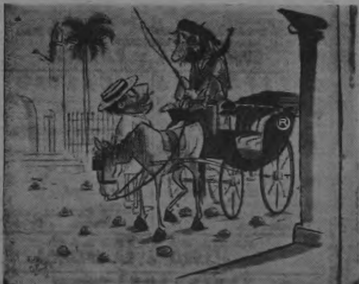
Vuelve la tracción animal a Cuba